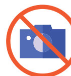
фото- або відеофіксація у будь-який спосіб

присутність інших осіб у кабіні для таємного голосування