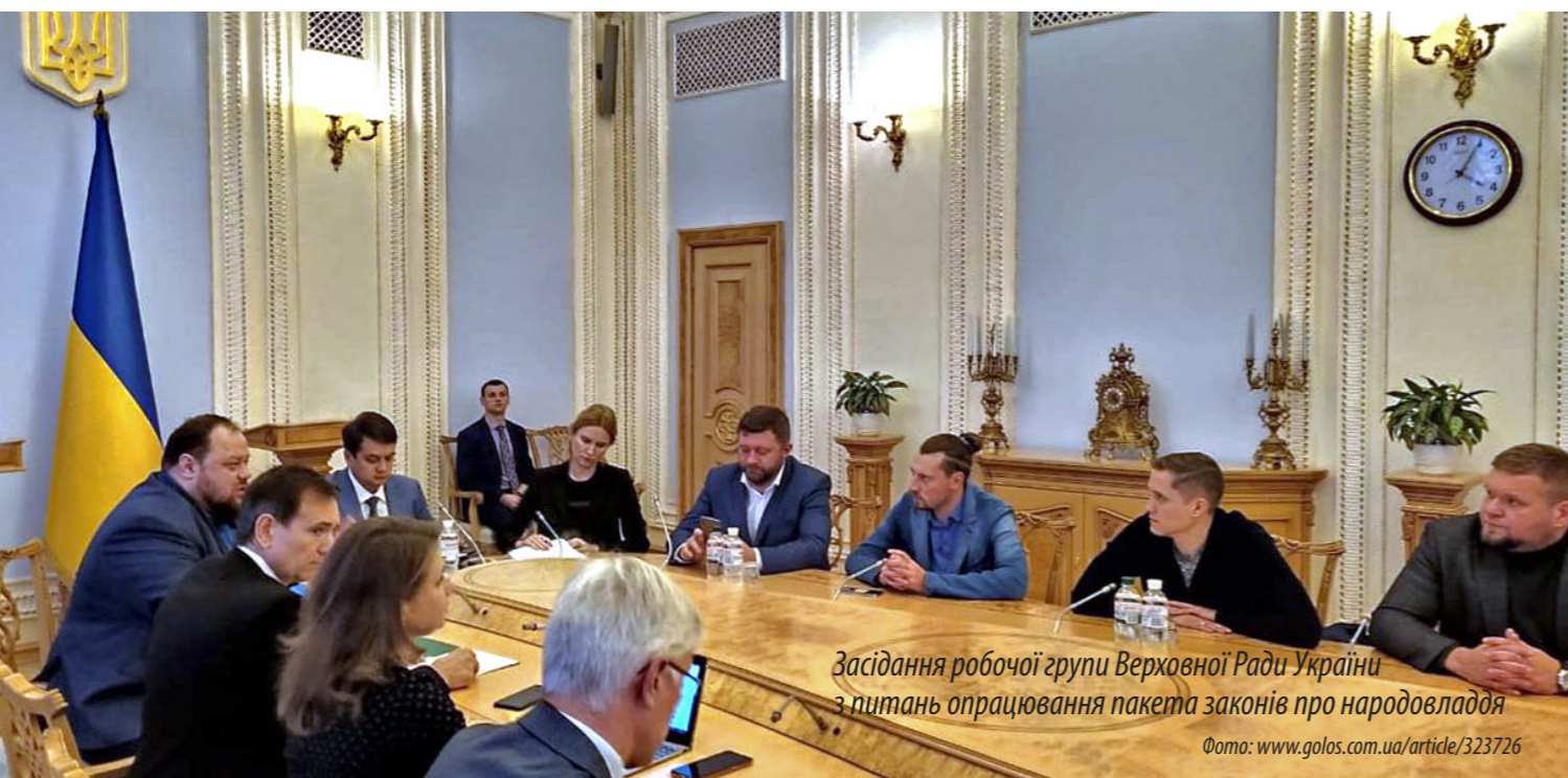
Засідання робочої групи Верховної Ради України з питань опрацювання пакета законів про народовладдя