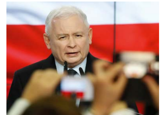
Ярослав Качинський, лідер консервативної партії "Право і справедливість"

Правляча партія "Право і справедливість" користується високою підтримкою виборців через масові соціальні реформи, проведені нею останніми роками.