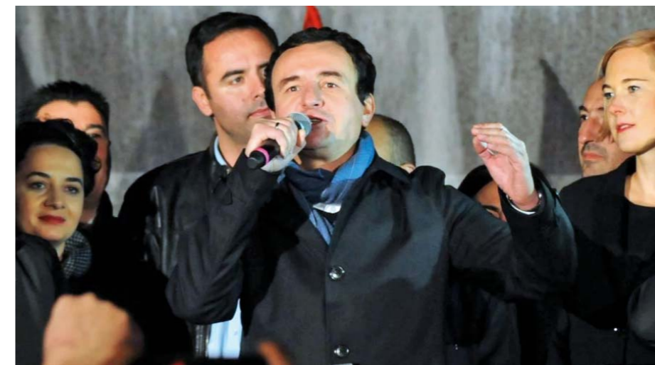
Альбін Курті, лідер руху "Самовизначення"

Перемогу здобули опозиційні партії, що виступають за відновлення діалогу про нормалізацію відносин із Сербією. Партія "Самовизначення" (Vetëvendosje) набрала майже 26 відсотків, а "Демократична ліга Косова" (LDK) – 25 відсотків голосів виборців.