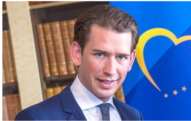
Себастьян Курц, голова консервативної Австрійської народної партії

В Австрії на дострокових парламентських виборах, які відбулися 29 вересня, перемогла консервативна Австрійська народна партія (АНП) на чолі з головою, колишнім канцлером Себастьяном Курцем, набравши 38,4% голосів. На другому місці – Соціал-демократична партія (21,5% голосів). Австрійська партія свободи, яка раніше формувала коаліційний уряд з прихильниками Курца, набрала 17,3% голосів. Крім того до парламенту пройшли "Зелені" (12%) і праволіберальна партія "Нова Австрія" – 7%.