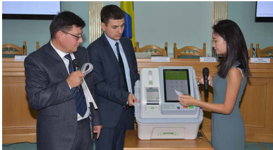
Презентація апарату для електронного голосування. Вересень, 2017. Київ, ЦВК.

Згадувана система Smart-ID (підпис в смартфоні + хмара) ідентифікує не людину, а її смартфон, який легко можна викрасти. Окреме питання щодо забезпечення системи безпеки збереження даних в хмарі. Цей підхід може використовуватись для чого завгодно, але не для таких важливих речей як голосування чи проведення операції з реєстрами. Навряд чи люди будуть щасливі, що після того, як вони загубили смартфон, зіткнулись з тим, що їм не належить їх квартира чи машина, чи створений ними бізнес. А ті, хто розуміє ризики, завчасно подбає про заборону операцій з майном чи бізнесом без особистої присутності.