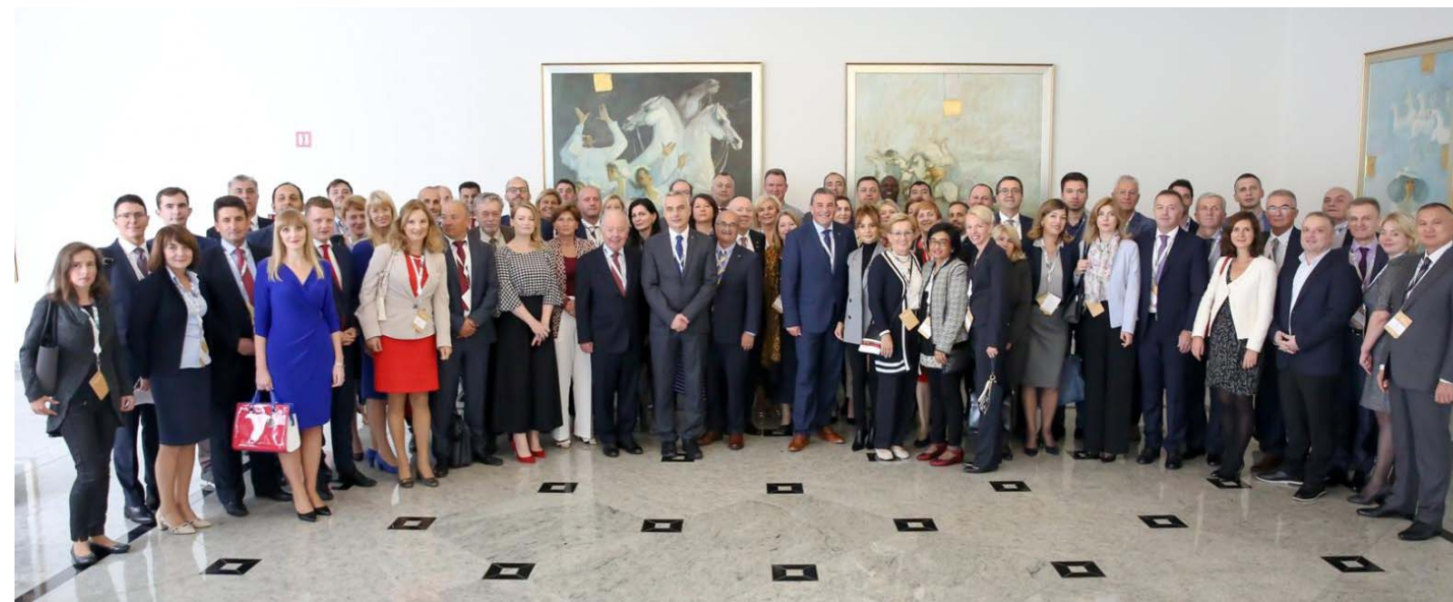
Учасники 28-ї щорічної конференції АСЄЕЕО «Судовий захист виборчих прав та прозорість виборів». 24–26 вересня 2019 року, Любляна, Словенія.

активних та пасивних аспектах захисту права голосу; спілкуванні ОАВ з громадянами через засоби масової інформації та соціальні медіа; та прозорість як мету, якої можна досягти, забезпечивши достатній захист прав людини.